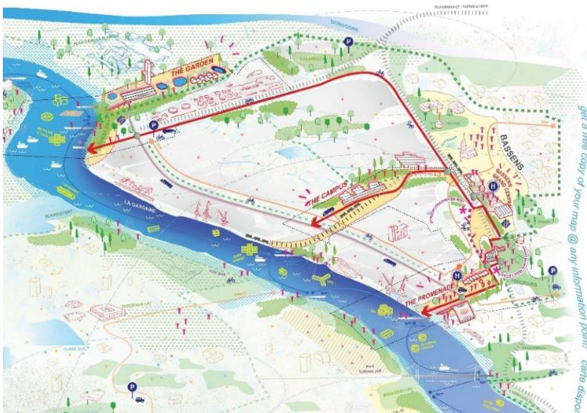
Image partielle extraite du dossier de candidature Garonne métropole – image recadrée