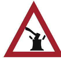
Couper des arbres