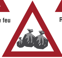
Déposer des déchets