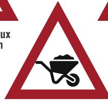
Déposer des remblais