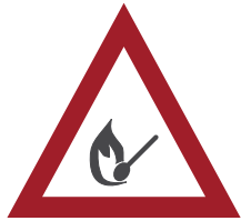
Débroussailler par le feu (écobuage)

Il est interdit, au risque de sanctions, de :