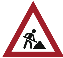
Réaliser des travaux sans autorisation